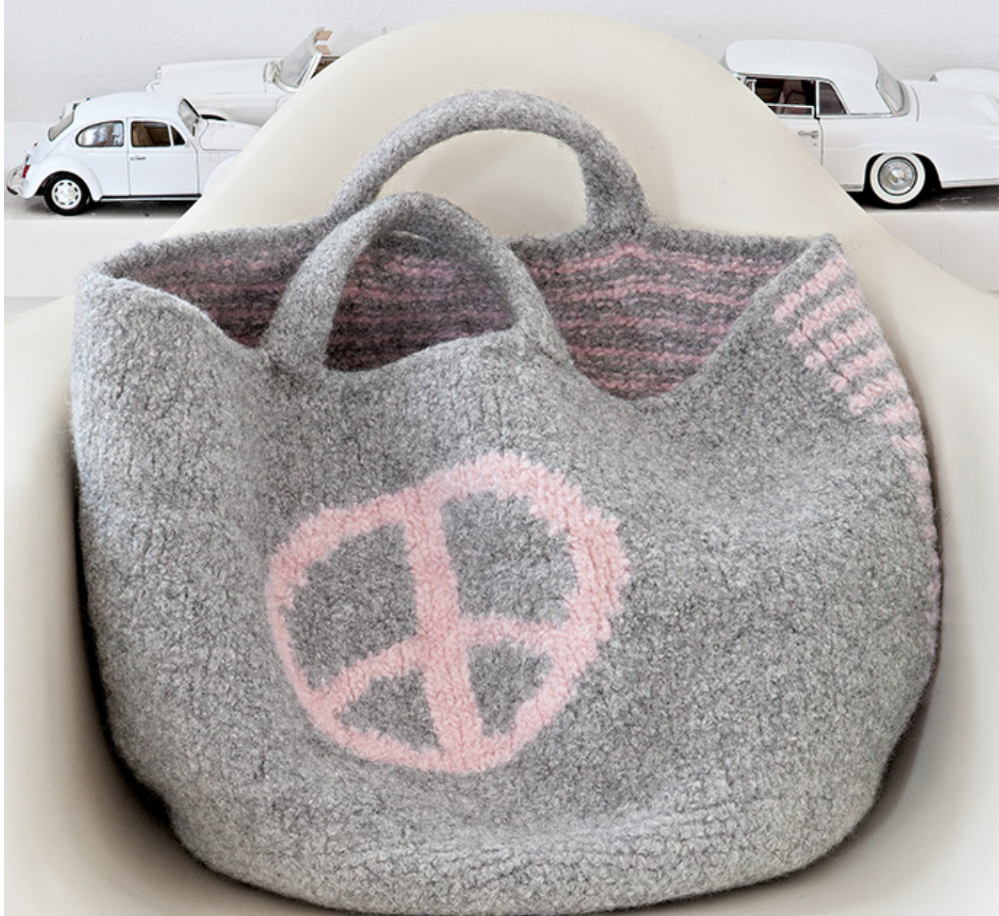
TASCHE PEACE · FELTRO Modell 06 aus Strick + Filz 10